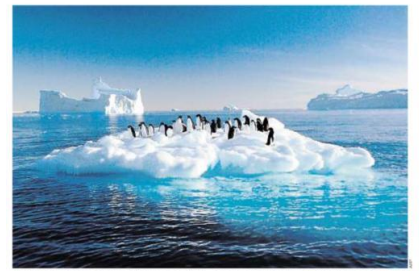
Le petit ice continent devient précipité. Un climat qui devient plus instable, ses effets se renforcent. Le déclin est au cœur sans doute. Selon les scientifiques, à moins d'un arrêt rapide et radical.

Strauss-Kahn mis en examen P.3 Dans l'affaire du Cartier, les juges ont jugé le patron du FMI d'avoir été le co-organisateur de parties fines. Il est mis en examen pour « proxénétisme aggravié en bande organisée ». La défense dénonce « un dossier vide ».