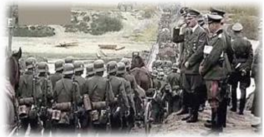
1939 : L'Allemagne envahit la Pologne

Après s'être allié avec l'Italie, Adolf Hitler commence par s'emparer de l'Autriche en 1938, sous prétexte qu'elle était peuplée d'Allemands. Ensuite, il fait pareil avec une partie de la Tchécoslovaquie. L'Europe qui voulait éviter la guerre le laisse faire. Mais Adolf Hitler pousse plus loin ses ambitions. Il envahit ainsi la Pologne le 1 er septembre 1939. La France et le Royaume-Uni, alliés de la Pologne, répliquent en déclarant la guerre à l'Allemagne nazie le 3 septembre. Ainsi, commence la seconde guerre mondiale. La première année se passe sans combat et sera appelée « la drôle de guerre ».