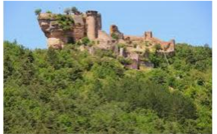
Le château de Peyrelade