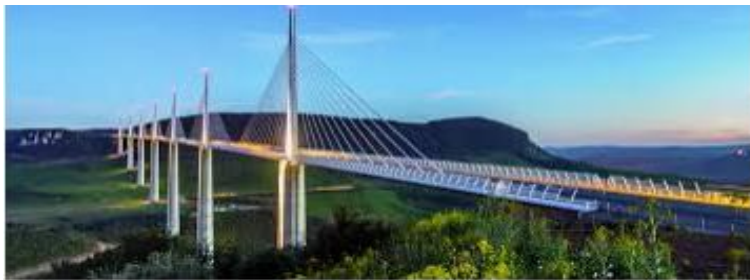
Le Viaduc de Millau