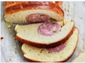
Le saucisson brioché