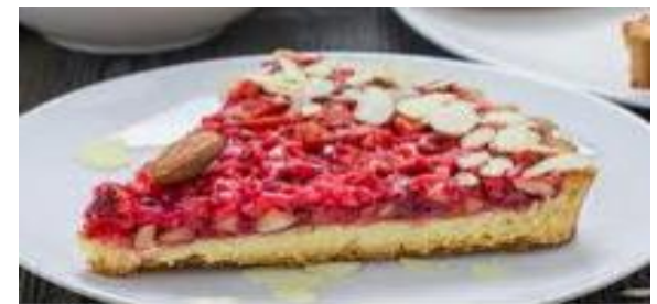
La tarte à la praline