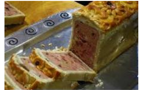
Pâté en croûte