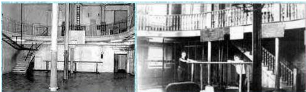
Gymnase du collège de Springfield

Pendant un hiver, les élèves n'avaient pas le droit de sortir à cause du temps car il y avait une tempête de neige. Ils courraient dans les couloirs alors pour retrouver du calme leur professeur a eu l'idée d'amener les garçons dans le gymnase.