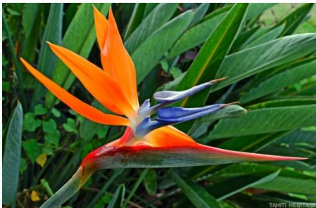
L'oiseau du paradis

En mer, la flore que l'on trouve est surtout le corail et les algues.