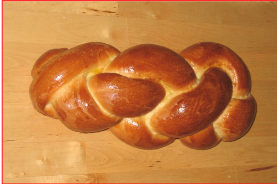
Zöpf (pain tressé suisse)