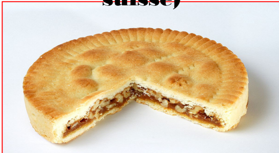
Bündner Nusstorte (tarte aux noix)