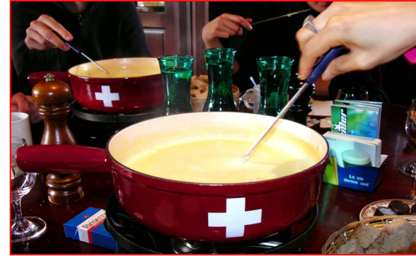
Fondue au Fromages