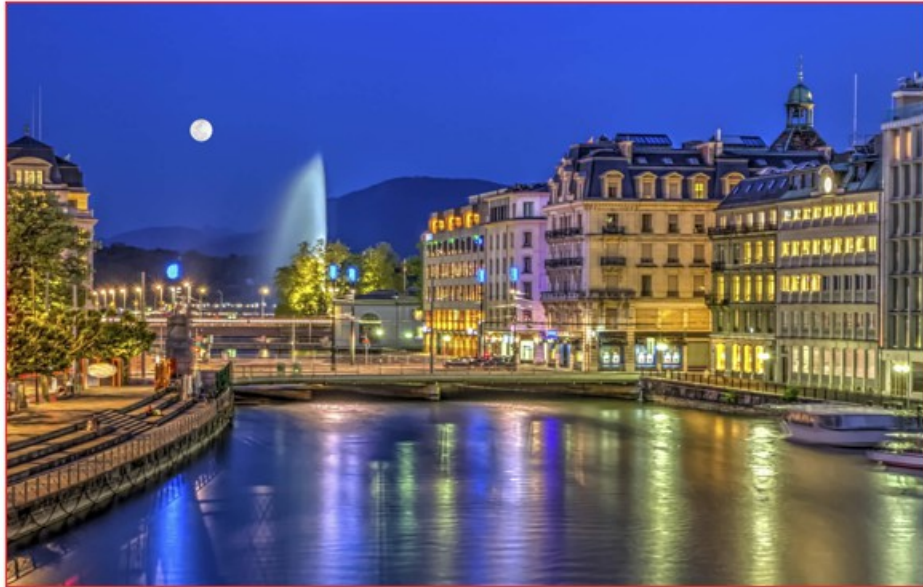
Ville de Genève

Genève est une ville suisse située à l'extrémité sud-ouest du Léman . Elle est la deuxième ville la plus peuplée de Suisse après Zurich . Elle est le chef-lieu et la commune la plus peuplée du canton de Genève (GE).