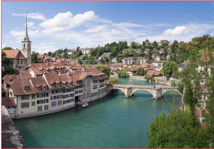
Vieille ville de Bern