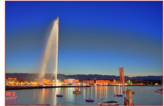
Jet d'eau Genève Culminant à 140m