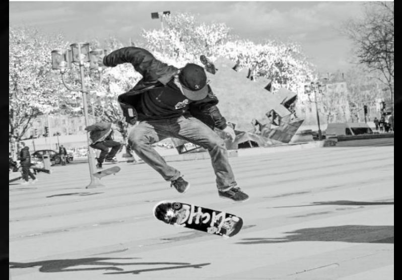
Skateur place Louis-Pradel