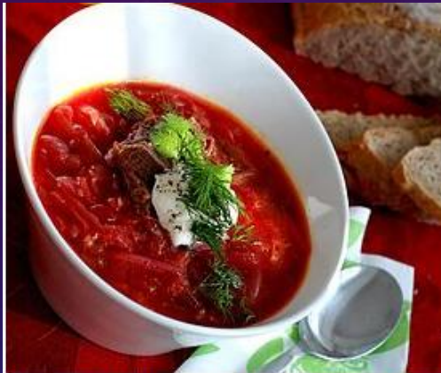
Bol de bortsch rouge, à base de betteraves, avec de l'aneth et de la crème aigre.

Le varenyky (Вареники) est un plat ukrainien traditionnel populaire et très ancré dans la cuisine ukrainienne.