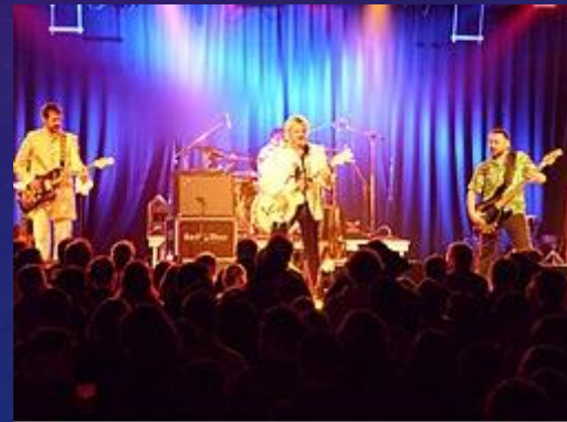
Vopli Vidopliassova en concert.