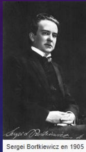
Sergei Bortkiewicz en 1905

La musique est essentiellement vocale et polyphonique (plusieurs mélodies ou chants). Il existe la musique traditionnelle avec les chants cosaques , la musique classique par exemple Sergueï Bortkiewicz , la musique actuelle avec le groupe de rock Vopli Vidopliassova