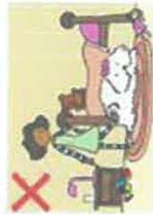
NE JAMAIS TRAPPER UN CHIEN