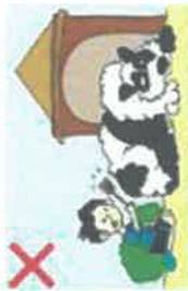
NE JAMAIS DERANGER UN CHIEN QUI SE REPOSE