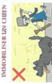
NE JAMAIS COURIR APRES UN CHIEN