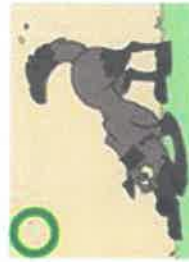
ON PEUT APPROCHER UN CHIEN QUI APPELLE AU JEU