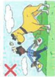
NE JAMAIS APPROCHER UN CHIEN EN COURANT