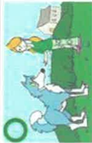
LAISSER LE CHIEN RENIFLER SA MAIN EN LUI PROPOSANT