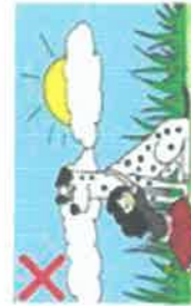
NE JAMAIS ENLACER OU IMMOBILISER UN CHIEN