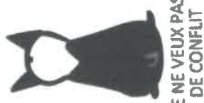
JE NE VEUX PAS DE CONFLIT