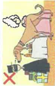
NE JAMAIS PIER UN CHIEN DANS LES YEUX