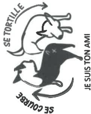
JE SUIS TON AMI