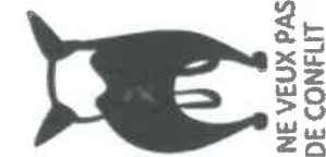
JE NE VEUX PAS DE CONFLIT