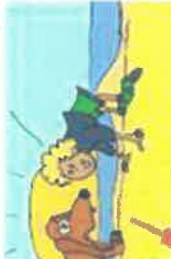
NE JAMAIS APPROCHER SON VISAGE DE LA TETE D'UN CHIEN