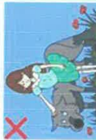
NE JAMAIS POSER SA MAIN SUR LA TETE D'UN CHIEN INCONNU