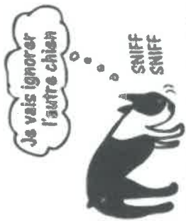
JE NE VEUX PAS DE CONFLIT