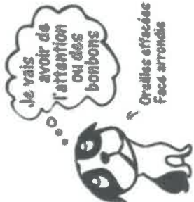
COMME QUAND J'ÉTAIS CHIOT