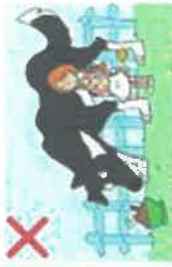
NE JAMAIS APPROCHER UN CHIEN QUI MANGE