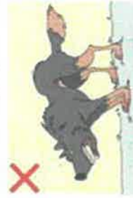
NE JAMAIS APPROCHER UN CHIEN AGRESSIF