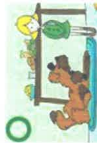
DETOURNER LE REGARD POUR APAISER LE CHIEN