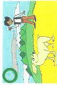
APPELER LE CHIEN PLUTOT QUE L'APPROCHER