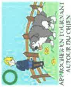
APPROCHER UN ENFANT AUTOUR DU CHIEN