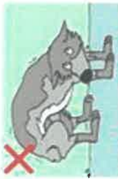
NE JAMAIS APPROCHER UN CHIEN APTURE