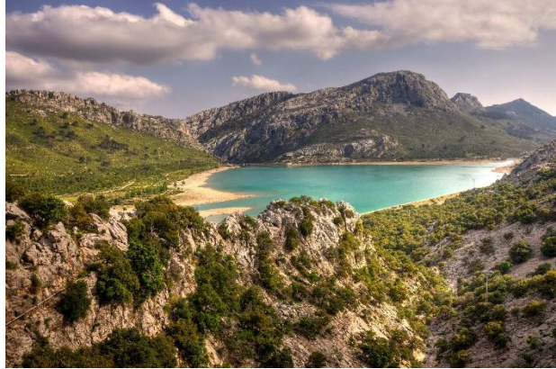
Puig de major

A Majorque, il y a plusieurs puigs (le puig de Pollença , le puig de Major le plus haut 1445 m d'altitude de Majorque) .