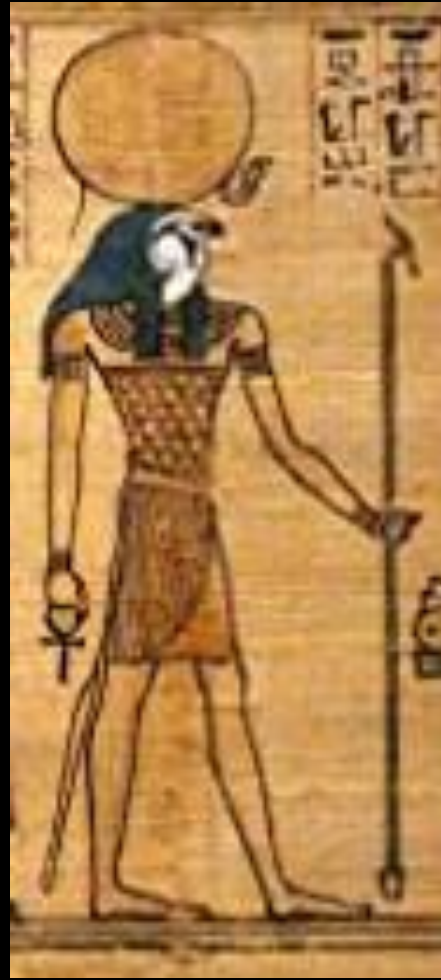
Rê ou Râ