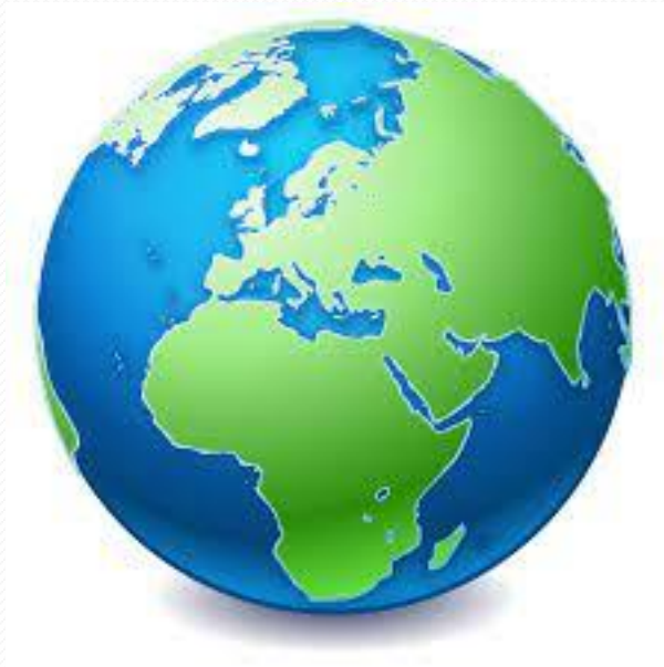
Répartition de l'eau sur terre