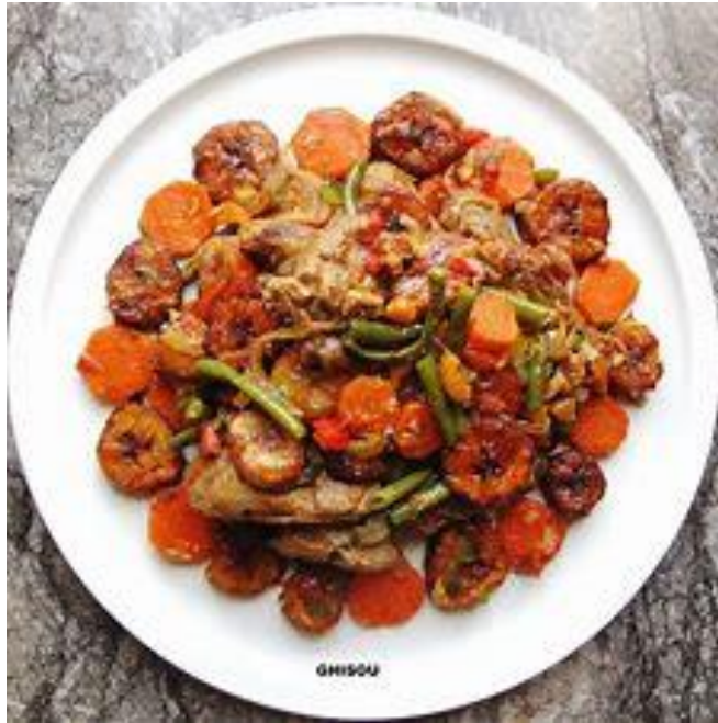
Le Poulet DG