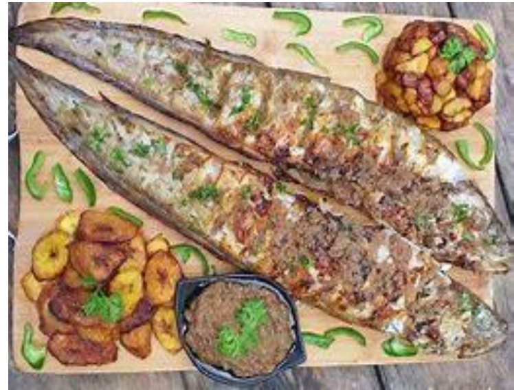
Le Poisson Braisé