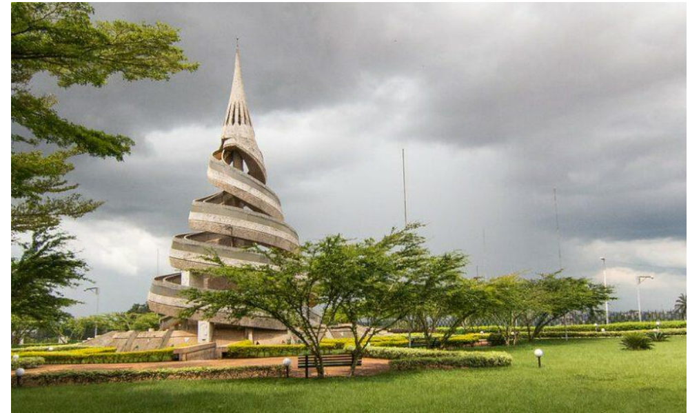
MONUMENT DE LA REUNIFICATION