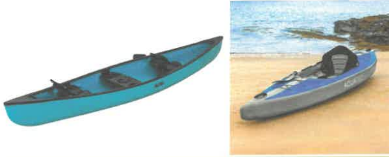
Un canoë ou un kayak